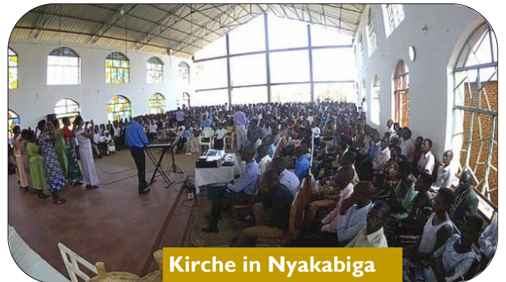
Kirche in Nyakabiga

einfachen Gebäuden über sich entwickelnde Gemeinden mit 100 und mehr Teilnehmern und im Bau befindlicher Kirche bis hin zu etablierten Gemeinden mit 1000 Gottesdienstteilnehmern reicht. Es geschieht mit Übersetzung, denn unser Kirundi ist immer noch sehr begrenzt.