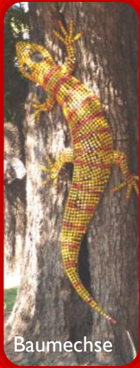
Baumechse aus Kronkorken

Wir genossen die Natur rund um die Viktoriafälle