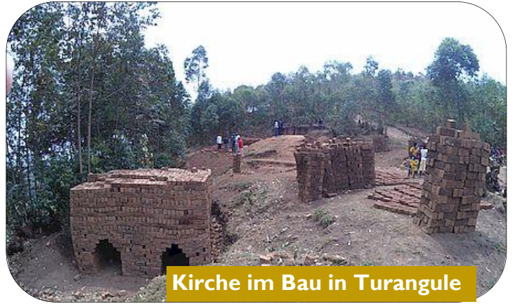
Kirche im Bau in Turangule

Spannend ist dabei, dass die Bandbreite von neu gegründeten Gemeinden mit bis zu 50 Teilnehmern in